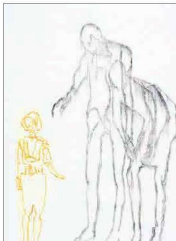
ØKONOMISK SYMBOLSPRÅK: «The Child» viser et barn sammen med to skikkelser som ligner trestammer med greier til armer.

Men i en verden basert på årsak og virkning, der tilstrekkelig mange gjør