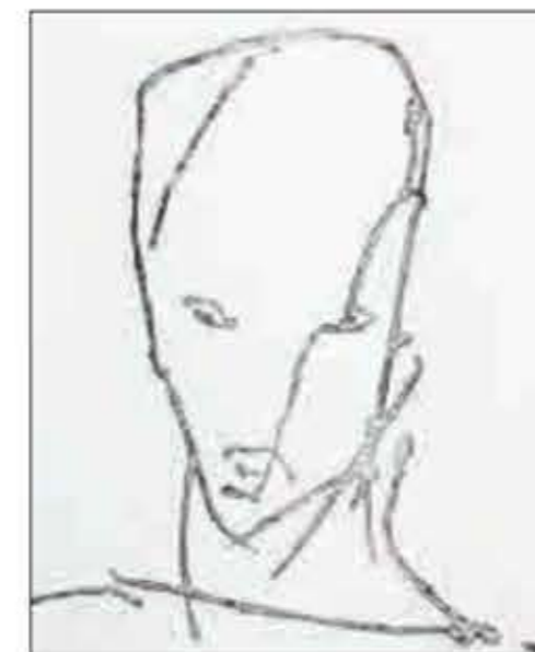
TRANSFORMASJON: i konstant endring.

Noen ganger understrekes visse partier av kroppen med en fetere strek, og preges bildene av en veldig økonomisk form for symbolspråk. Nesten umerkelig, men bare nesten. For eksempel i et arbeid som «The Child» som viser en barneskikkelse der streken går i gult, på kanten til gull. Over barnet henger det man kan tenke seg er foreldrene som to trestammer